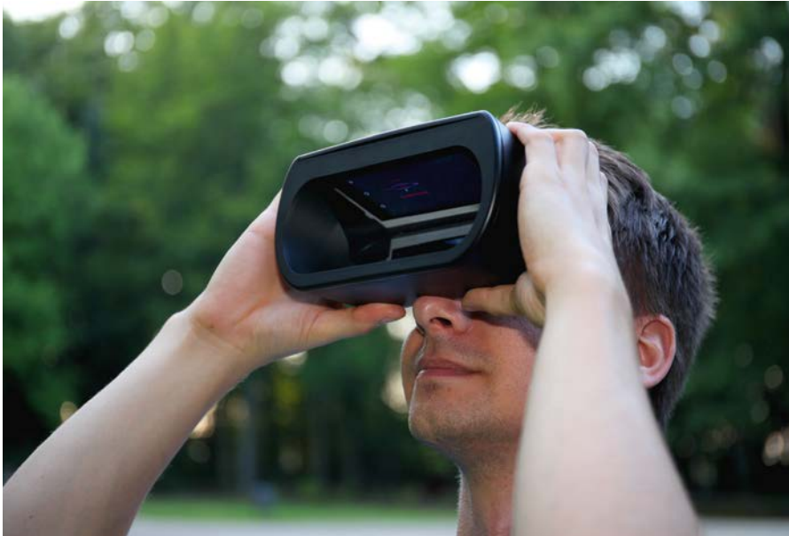
▲ Abb. 3: Der Beobachter nimmt die Brille mit dem darin befindlichen Smartphone in die Hand und blickt durch sie hindurch. Durch das geringe Gewicht von 175g (zzgl. Gewicht des Telefons) ist auch eine längere Beobachtung möglich. Stefan Fiebiger

Hier wird nach dem Anvisieren eines Sterns das Sternbild hervorgehoben, zu dem er gehört. Für weitere Informationen muss einfach für eine Dauer von etwa zwei Sekunden auf dem angezeigten Namen verweilt werden. Dadurch wird eine auditive Erklärung zu dem entsprechenden Sternbild ausgegeben. Im Entdecker-Modus stehen weitere Informationen zu den Sternen zur Verfügung. Beim Anvisieren öffnet sich hierbei ein Infowindow, in dem Daten zur Entfernung, Helligkeit und der Farbe angezeigt werden. Für sehr helle Sterne stehen vereinzelt auch gesprochene Daten zur Verfügung.