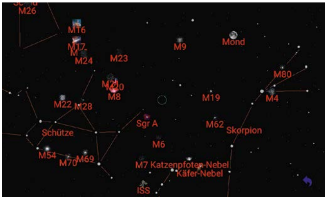
▲ Abb. 4: Die dazugehörige App weist verschiedene Modi auf. Hier wird der Modus der Universe2go-App ohne Beobachtungsbrille gezeigt. So kann direkt der anvisierte Himmelsausschnitt betrachtet werden. Stefan Fiebiger