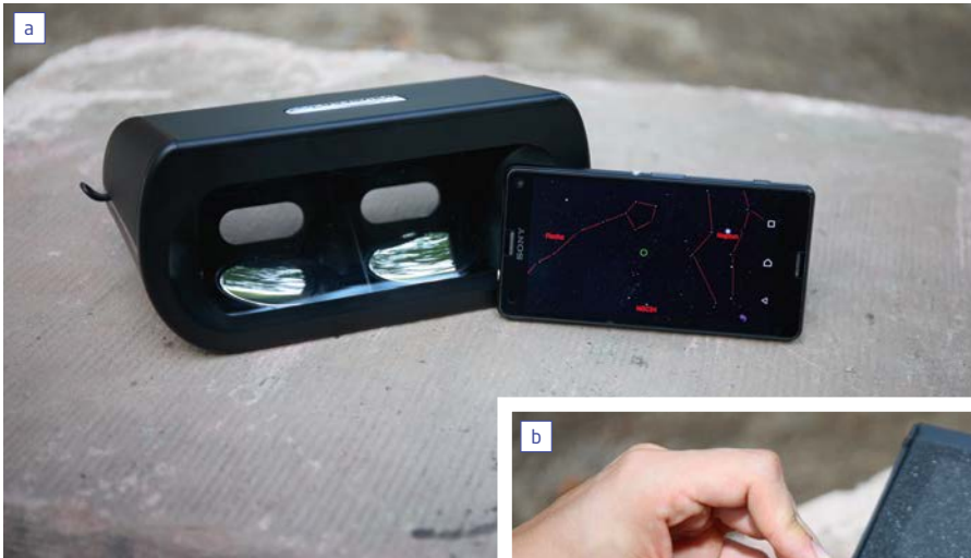
Abb. 2: Die Brille des Universe2go besteht aus einem Gehäuse, in dem sich ein Spiegel befindet. Wird das Smartphone an der dafür vorgesehene Position eingelegt, wird dessen Anzeige in das Blickfeld eingespiegelt. Stefan Fiebig

anzuzeigen. Diese völlig neuartige Technologie soll es auch kompletten Laien erlauben, den Sternhimmel kennen zu lernen. Die normalerweise bei Erklärungen des Sternhimmels problematische Frage der Identifikation von Sternen und Planeten entfällt. Im Idealfall wird auch ein völliger Laie in den Stand versetzt, sich den Sternhimmel ohne fremde Hilfe selbst zu erschließen.